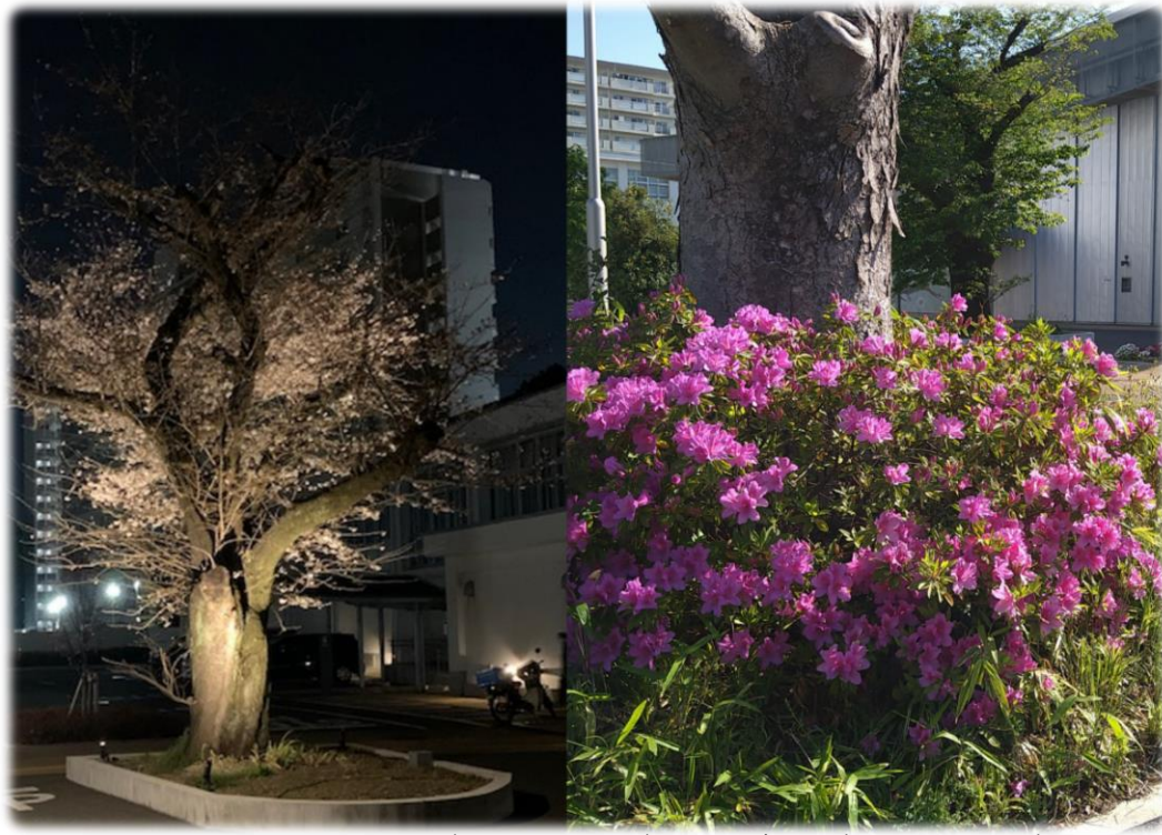
アキシマエンス入口の桜(3月22日撮影)とツツジの花(4月19日撮影)